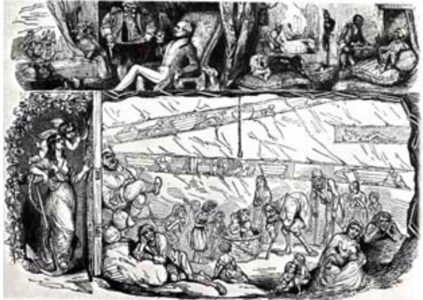
■ „Capital and Labour“, Anonyme Karikatur der sozialen Verhältnisse in England aus „Punch“, 1843.

4. Die Industrialisierung Deutschlands und die Entstehung der „Sozialen Frage“